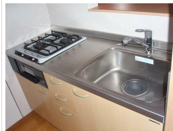
カウンターキッチン

※この図面はATBBの物件情報の一部を抜粋して掲載しております。(現況優先) ※入居日・引渡日変更や付帯条件、別途料金が発生する場合がありますのでご確認ください。